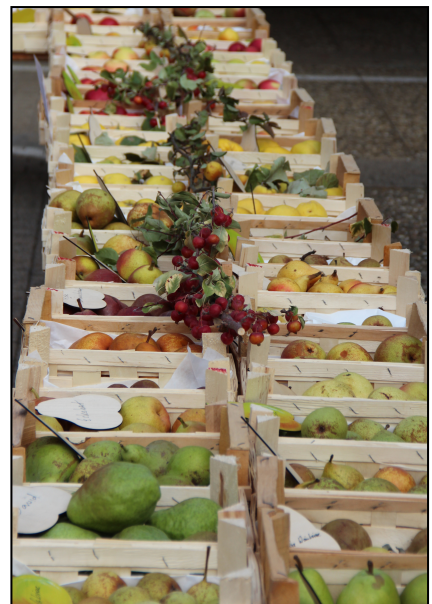
Bild: Obstbestimmung beim AHA-Tag